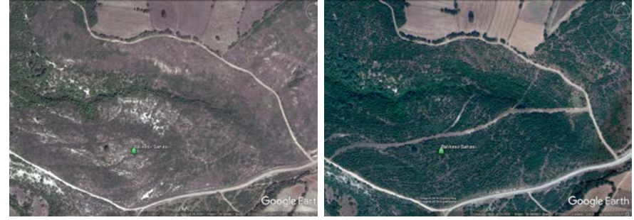
Balıkesir Sahası 2010

Orman Genel Müdürlüğü ve İş Bankası iş birliğiyle 2008 yılında uygulamaya koyduğumuz ve 10 yılda 2,2 milyon fidanı toprakla buluşturduğumuz proje kapsamında 6 ilde çalışmalara devam ettik. Bakım ve tamamlama dikimi ihtiyacı devam eden sahalarda saha kontrolleri gerçekleştirdik. Projenin 2018 yılsonu ortalama fidan başarısı %83 oldu. Birçok sahada dikilen fidanlar büyüyerek sahada kapalılık oluşturmaya başladı.